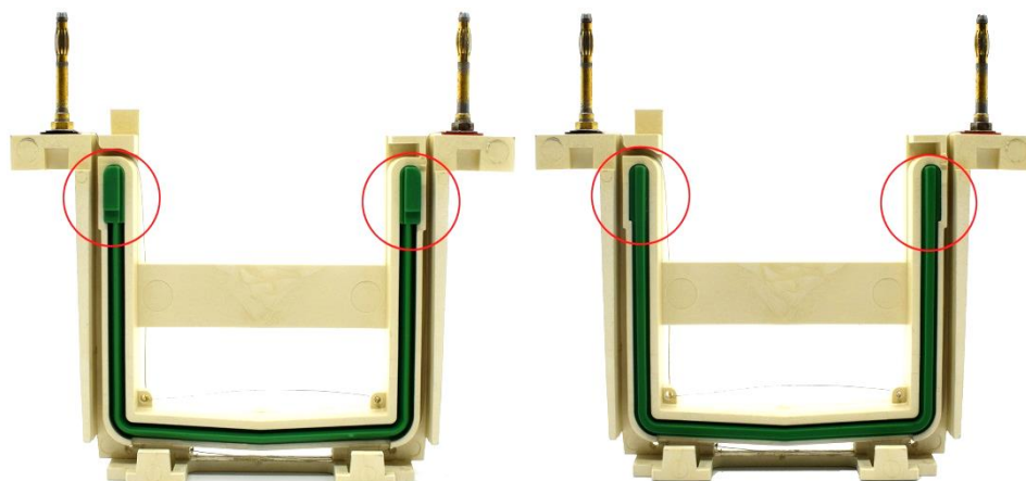
图1. Bio-Rad公司的Mini-PROTEAN® Tetra Cell电泳槽U型硅橡胶密封条的突起结构图。由于碧云天的BeyoGel™ Plus PAGE预制胶的该部位是平的，使其兼容几乎所有厂家的小型胶电泳槽，所以电泳时须将具有突起结构的硅橡胶密封条(左图)取出后反过来安装(右图)，使其没有突起的平滑面朝外，从而防止漏液。